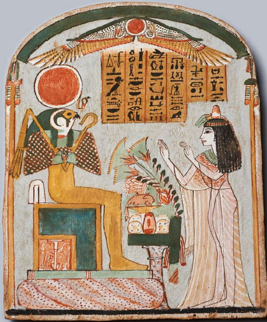
Bild aus dem Grab (KV64) der Sängerin des Amun, Nehemesbastet University of Basel Kings' Valley Project, M. Kacicnik