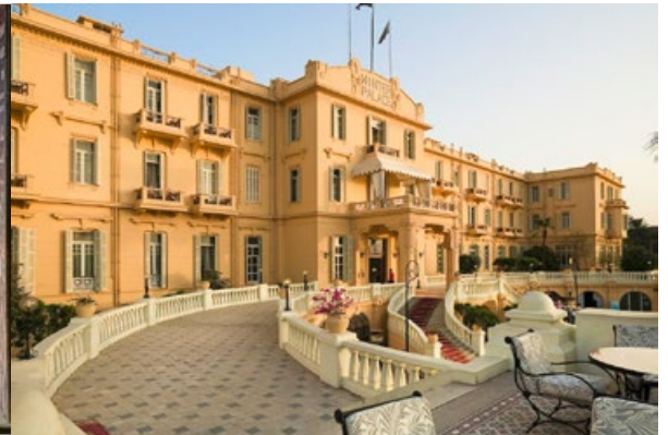
Links: Die von Alumni Basel gestiftete Vitrine im Luxor-Museum. Rechts: 5*-Luxushotel Winter Palace Luxor