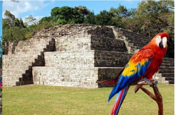
Links: Atitlánsee in Guatemala / rechts: Maya-Ruinen in Copan, Honduras