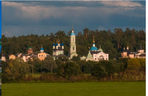
Links: Katharinenpalast in Zarskoje Selo / rechts: Kloster Optina, wo Dostojewski und Gogol Rat suchten