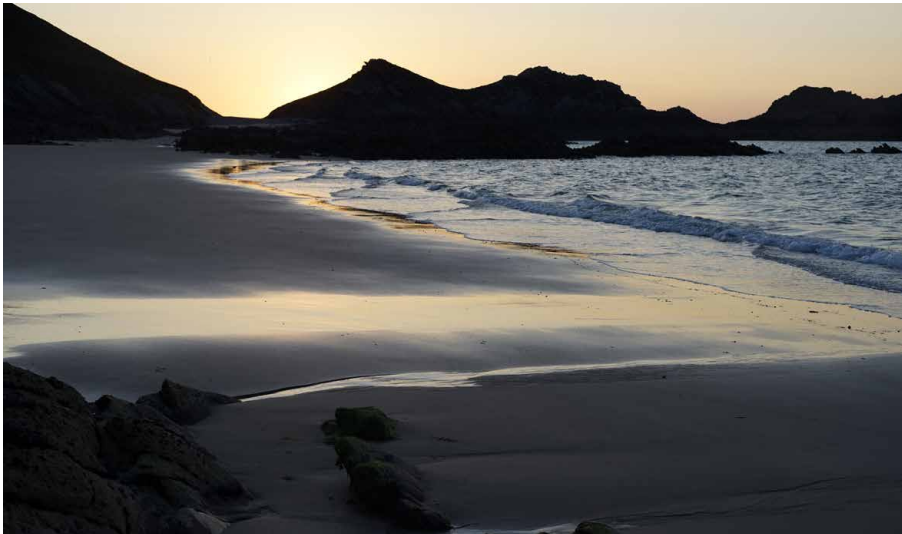
Links: Auf einem Nachspaziergang erleben Sie mit etwas Glück das «Meeresleuchten». Rechts: Algen sind DIE Produzenten des Meeres