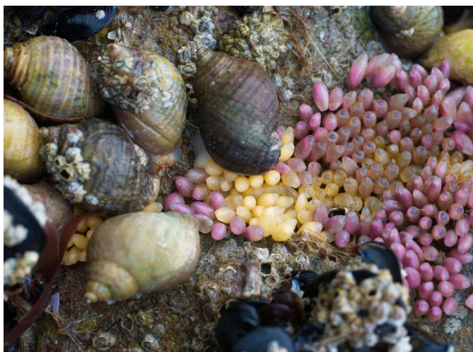
Purpurschnecken waren einst Gold wert

Auf der spektakulären Landzunge des Cap Fréhel beobachten wir die Meeresvögel, die jeden Frühling hier in den senkrechten, sieben Meter hohen Felsen brüten. Wir erleben