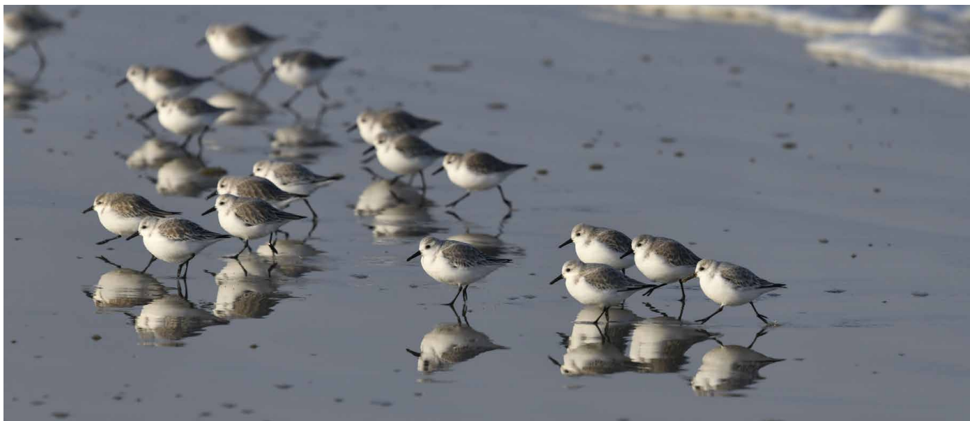
Sanderlinge auf einem Zwischenhalt. Sie brüten gern in der Arktis und können bis nach Südafrika fliegen.