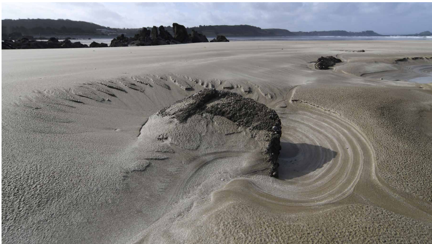
Bald tosen hier wieder meterhohe Wellen. Gezeiten sind eine gigantische Herausforderung für jedes Lebewesen.

Kormorane, Mantel- und Silbermöwen und Eissturmvögel hautnah. Der weithin sichtbare Leuchtturm aus den 1940-er Jahren ist im Sommer begehbar.