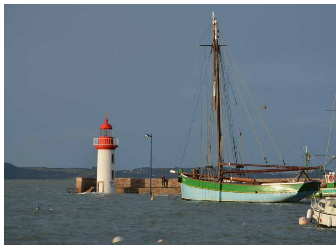
Leuchtturm und Segeschiff, zwei Helfer der Küstenbewohner