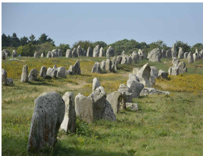
Carnac: 3000 Menhire aus der Prähistorie in Reih und Glied

In der Dunkelheit des Neumonds machen wir uns mittenachts noch einmal auf den Weg an den Strand. Es lockt die Chance, das von Mikroorganismen erzeugte Meeresleuchten hautnah zu erleben. Sicher ist dies nicht, dafür bieten manch andere Tiere des Strandes genug Aufregendes.