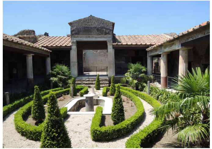
Blick in den Innenhof der Casa degli Amorini Dorati

verständlich gehört auch ein Blick in das Gabinetto Segreto dazu. Der Nachmittag steht Ihnen in Neapel zur freien Verfügung. Die faszinierende Altstadt hat für jeden Geschmack etwas zu bieten.