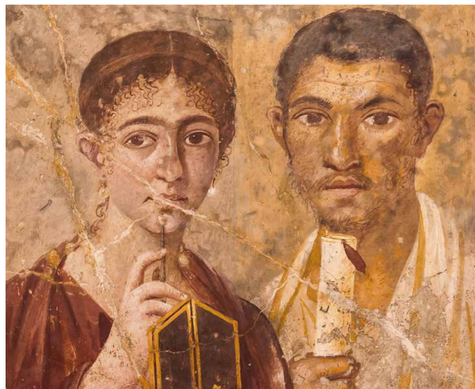
Porträt des Terentius Neo und seiner Frau (im Nationalmuseum Neapel)

Im Nationalmuseum von Neapel sind die berühmten Fund- und Kunstobjekte aus den Vesuvstädten ausgestellt. So lässt sich bei einer gemeinsamen Führung beispielsweise das Alexander-Mosaik bewundern. Selbst-